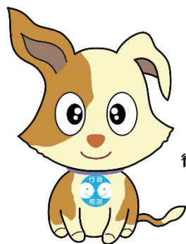
行政相談のマスコット キクーン